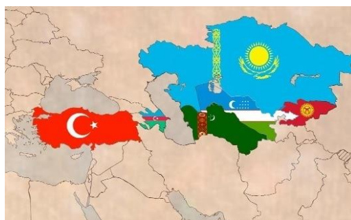
Таблица 2. Среднеазиатский регион и Турция